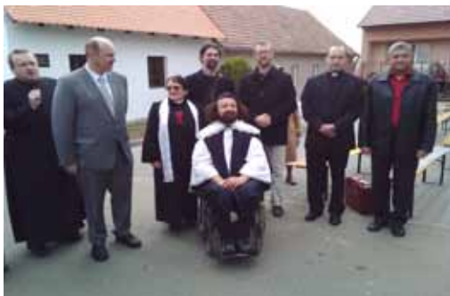
... přijel i sám J. A. Komenský...