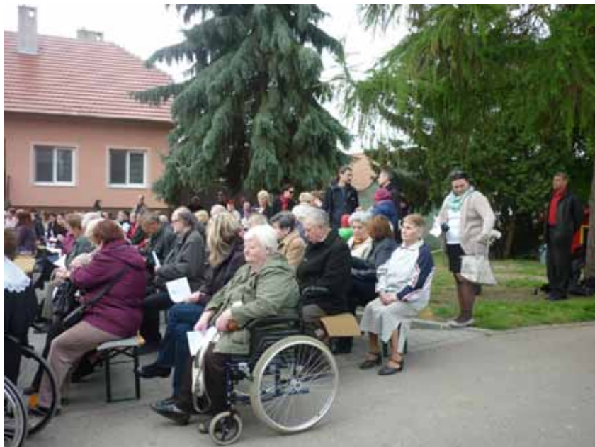
Fotografie z ekumenické bohoslužby v Žeravicích