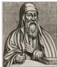
Rytina s Origenovým portrétem

V tomto článku bychom rádi pohovořili o jedné z nejvýraznějších křesťanských osobností starověké církve – o Origenovi z Alexandrie, který byl nejenom pravým mistrem, jak jej nazývali jeho žáci, ale především brilantním teologem a příkladným učitelem víry. 1 Origenes působil v první polovině 3. stol. n. l. V té době již církev představovala důležitou a velkou sílu v rámci římského impéria, která začala přitahovat i bohaté či vzdělané lidi. Je tedy zřejmé, že v takto měnící se církvi muselo nutně dojít ke změně důrazu, což znamená posun od praktického křesťanství k hlubšímu promyšlení vlastní teologie, filozofie či politiky. A právě Origenes „byl prvním velkým filozofem, který nové náboženství promyslel od jeho samých základů“. 2