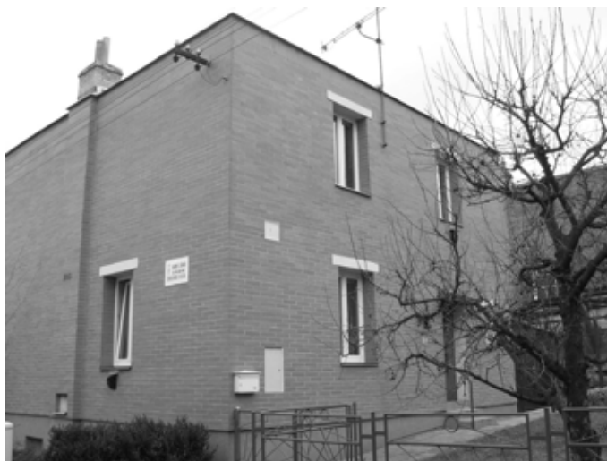
Fara Náboženské obce ve Zlíně