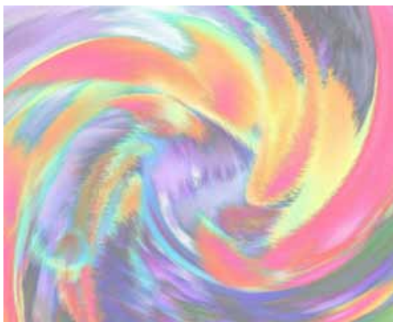
Grafika: Václav Kovalčík

Nadějí promlouvá malebný vid v náruči přírody